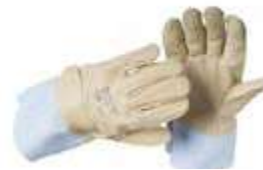
4 CL0303EOHY EN 388