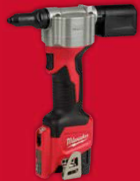
Modèle présenté M12 BPRT-201X