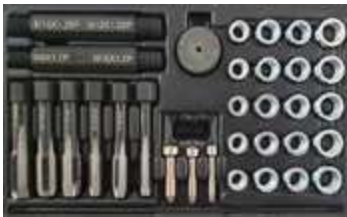
REF. WT9103 COFFRET REPARATION FILETAGE BOUGIES DE PRECHAUFFAGE (33PC)