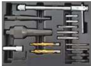
REF. WT0103 COFFRET EXTRACTEURS DE BOUGIES DE PRECHAUFFAGE ET REPARATION FILETAGE (15PC) - POUR LES BOUGIES DE PRECHAUFFAGE AVEC FILETAGE M8 X 1.0 ET M10 X 1.0