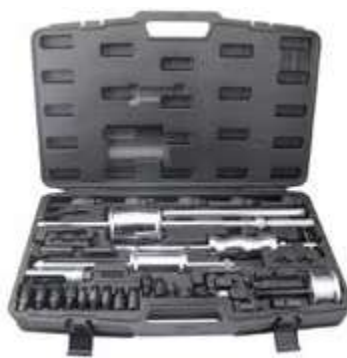
REF. WT3303 COFFRET EXTRACTEURS INJECTEURS DIESEL UNIVERSEL (40PC) - PERMET D'EXTRAIRE LES INJECTEURS LES PLUS RECALCITRANTS AVEC UN MINIMUM D'EFFORT