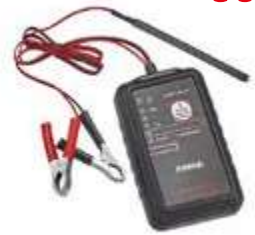
REF. 885G01 ANALYSEUR BOUGIES DE PRECHAUFFAGE - PERMET DE DIAGNOSTIQUER UNE DEFAILLANCE DE BOUGIE DE PRECHAUFFAGE SANS LA DEMONTER DU MOTEUR