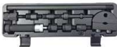
REF. WT1303 COFFRET EXTRACTEURS INJECTEURS IMPACT (10PC) - PERMET D'UTILISER LES VIBRATIONS ET LES IMPACTS PRODUITS PAR LE MARTEAU/BURIN PNEUMATIQUE POUR EXTRAIRE DES COMPOSANTS - ADAPTATEUR M14 X 1.0 > DELPHI - ADAPTATEUR M17 X 1.0 > BOSCH - ADAPTATEUR M20 X 1.0 > DENSO - ADAPTATEUR M25 X 1.0 > SIEMENS - ADAPTATEUR M27 X 1.0 > SIEMENS - ADAPTATEUR M27 X 1.0 > BOSCH