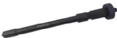
REF. 9G0118 EXTRACTEUR DE JOINTS D'INJECTEURS - PERMET DE RETIRER LES BAGUES D'ETANCHEITE EN CUIVRE COINCEES A LA BASE DE L'INJECTEUR DIESEL D'UN DIAM < A 7MM