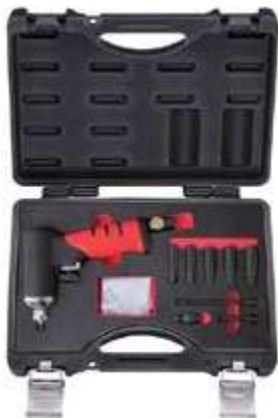
REF. 909G6 CLE A CHOCS POUR BOUGIES DE PRECHAUFFAGE (9PC) - PERMET DE RETIRER LES BOUGIES BLOQUEES OU GRIPPEES SUR UN MOTEUR DIESEL - 4 REGLAGES DE COUPLES 10 20 30 ET 40NM - COMPREND 5 DOUILLES IMPACT 8 9 10 11 12MM, 2 RALLONGES ET UN CARDAN UNIVERSEL