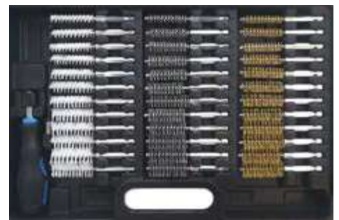
REF. WT4003 COFFRET DE BROSSES DE NETTOYAGE (38PC) - 12 X BROSSES NYLON 8 - 9 - 10 - 11 - 12 - 13 - 14 - 15 - 16 - 17 - 18 - 19MM - 12 X BROSSES ACIER 8 - 9 - 10 - 11 - 12 - 13 - 14 - 15 - 16 - 17 - 18 - 19MM - 12 X BROSSES CUIVRE 8 - 9 - 10 - 11 - 12 - 13 - 14 - 15 - 16 - 17 - 18 - 19MM