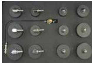
REF. WT7414 COFFRET TESTEUR DE FUITES POUR SYSTEME TURBO - POUR LES MOTEURS VL DIESEL ET ESSENCE - LIVRE AVEC ADAPTATEURS DIAM 31 38 46 51 56 61MM - PEUT ETRE UTILISE AVEC UN GONFLEUR D'AIR