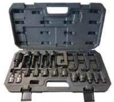
REF. WT2303 COFFRET EXTRACTEURS INJECTEURS DIESEL UNIVERSEL (25PC) - CONVIENT POUR UNE LARGE GAMME DE VEHICULES MERCEDES BMW VAG AUDI PSA VOLVO FORD MAZDA TOYOTA...