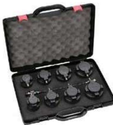
REF. WT7404 COFFRET TESTEUR DE FUITES POUR SYSTEME TURBO - CONCU POUR INSUFFER DE L'AIR REGULE A BASSE PRESSION DANS LE SYSTEME TURBO POUR MONTRER LA PRESENCE DE FUITES DANS LE SYSTEME - 4 X OBTURATEURS CONIQUES DE 55 A 94MM