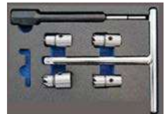
REF. WT0033 COFFRET NETTOYAGE SIEGES D'INJECTEURS DIESEL (7PC) - CONVIENT POUR UNE LARGE GAMME DE VEHICULES MERCEDES BMW PSA RENAULT FIAT ET FORD