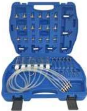
REF. WT5404 COFFRET DE MESURE DE DEBIT DE RETOUR COMMON RAIL (31PC) - COMPREND DES TUBES ET FLACONS GRADUES, TUYAUX FLEXIBLES ET ADAPTATEURS INJECTEURS BOSCH DELPHI DENSO ET SIEMENS - PERMET UNE MESURE SIMULTANEE JUSQU'A 6 INJECTEURS