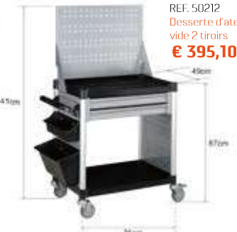
REF. 50212 Desserte d'atelier vide 2 tiroirs € 395,10