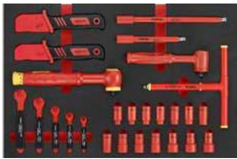
2 3262 IEC 60900