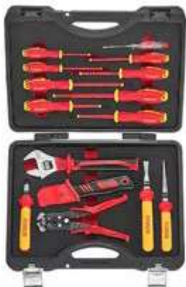
REF. 5157N COFFRET OUTILS ISOLES TOURNEVIS, PINCES, CLES (15PC)