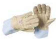
5 CL0303E0HY EN 388