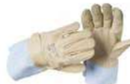
4 CL0303EOHY EN 388