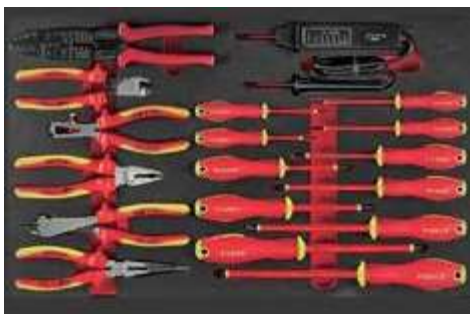
1 2182N IEC 60900

DÉPANNAGE VEHICULES HYBRIDES ET ELECTRIQUES