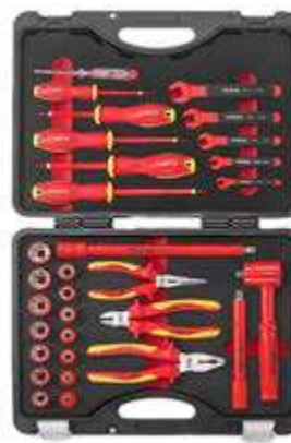
REF. 3313N COFFRET HYBRIDE 3/8" TOURNEVIS, DOUILLES, CLES, PINCES, RALLONGES (31PC)