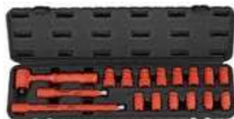
REF. 3173N COFFRET OUTILS ISOLES 3/8" DOUILLES ET RALLONGES (17PC)