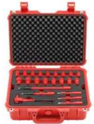
REF. 605003 COFFRET OUTILS ISOLES 3 NIVEAUX TOURNEVIS, CLIQUETS, DOUILLES, PINCES 3/8" (47PC)

DEPANNAGE VEHICULES HYBRIDES ET ELECTRIQUES, OUTILLAGE ISOLE